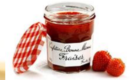
Confiture Bonne Maman