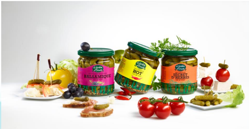
Cornichons Jardin D'Orante